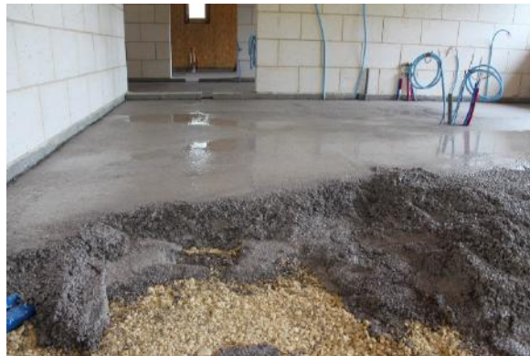
Béton de chaux avec pouzzolane (noir) en cours de réalisation - Maison La Bourgogne - ©Saint-Astier

En coulant un dallage en béton de ciment, tous les transferts d'humidité qui se faisaient au niveau du sol se retrouvent bloqués et remontent par capillarité, en périphérie dans les murs. C'est ce que l'on peut également appeler « l'effet mèche ».