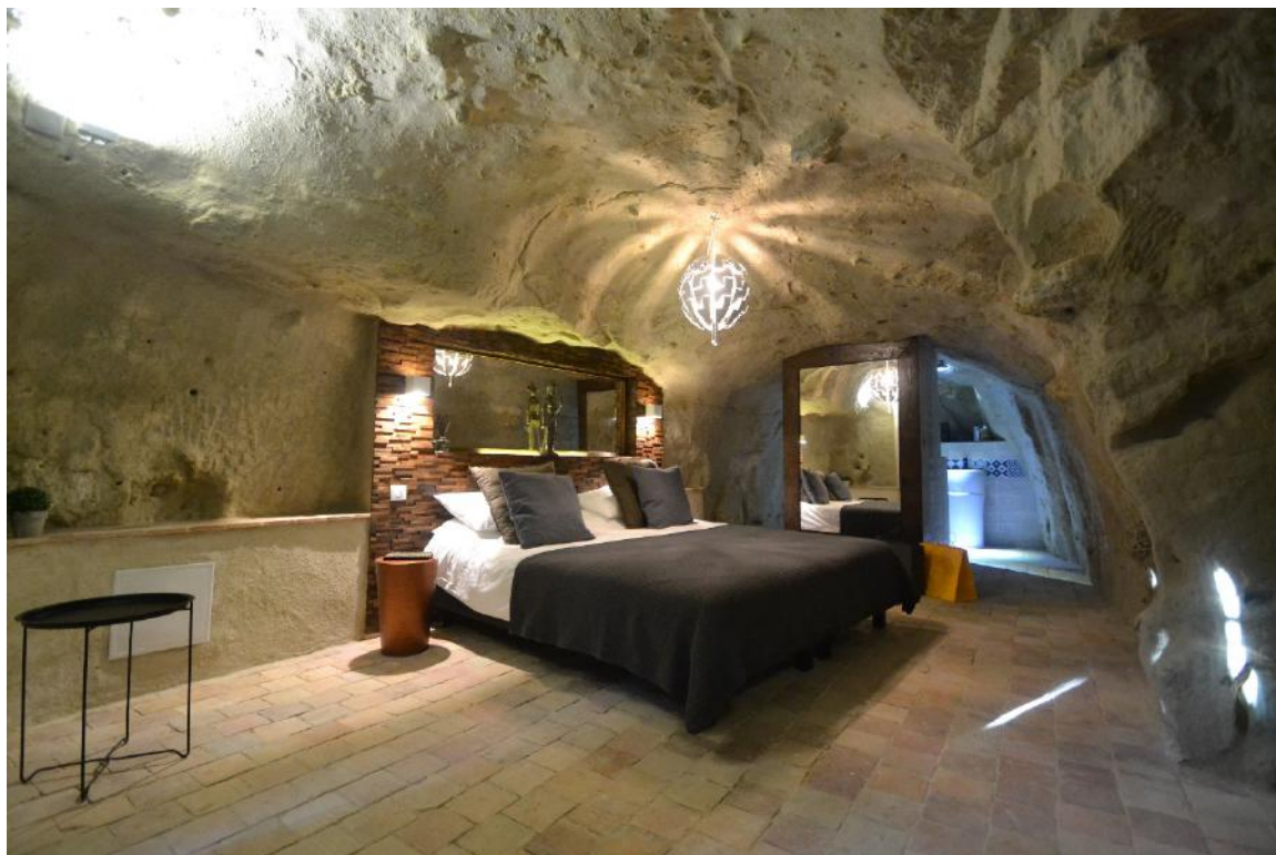
Maison troglodyte à Azay Le Rideau (37) - béton de chaux et finition en tommettes en terre cuite.

Le béton de chaux redevient incontournable dans la restauration pérenne du bâti ancien ( maisons anciennes, caves, maisons troglodytes, chais viticoles... ), on peut même l'utiliser aujourd'hui en construction neuve. Sans polyane ni armature ( ferrailage ), le dallage est un béton non structural parfaitement adapté à la rénovation du bâti ancien.