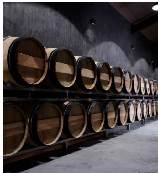
Maison troglodyte en béton de chaux et béton de chaux dans un chais viticole

Le savoir-faire de Minier béton permet des livraisons sur les chantiers d'accès difficiles (pompage du béton). Le béton de chaux est facile à mettre en œuvre, il s'égalise au râteau et se nivelle avec les outils appropriés. Un dispositif anti-retrait, fibres synthétiques, peut être incorporé au béton de chaux afin de limiter les retraits.