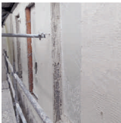
Vue de la couche de 8 cm une fois terminée