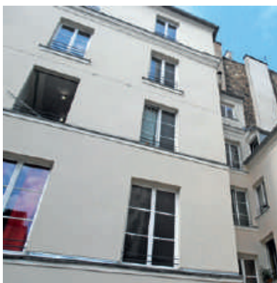
Chantier terminé - Façade rénoverée en PARIS DÉCO®