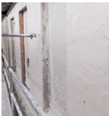
Vue de la couche de 8 cm une fois terminée