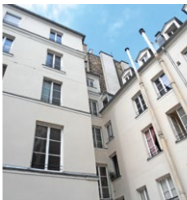
Chantier terminé - Façade rénovée en PARIS DÉCO®