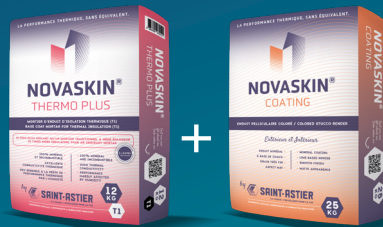
NOVASKIN® THERMO PLUS Sous-enduit