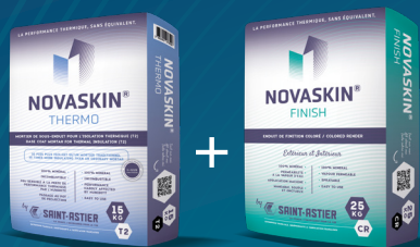
NOVASKIN® THERMO Sous-enduit