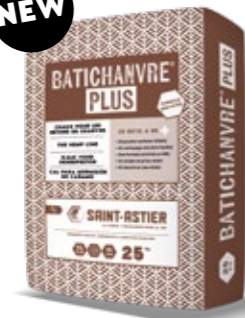
BATICHANVRE® PLUS 25 KG L'Historique