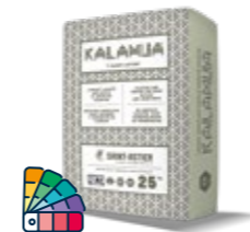
KALAMUA® 25 KG