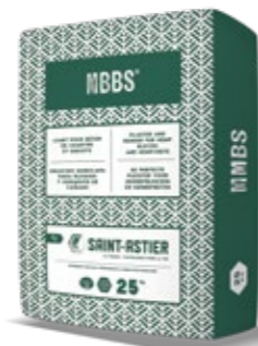
MBBS® - 25 KG Mortier prêt-à-l'emploi pour blocs biosourcés (chanvre, lin, colza...)