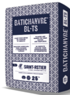
BATICHANVRE® BL-TS 25 KG Pour support plâtre et chaux