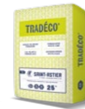
TRADÉCO® 25 KG