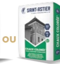
CHAUX COLORÉE® 30 KG