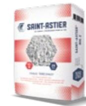
TÉRÉCHAUX® NHL2 - 25 KG