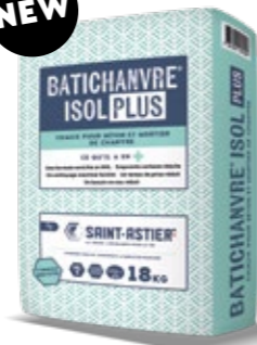
BATICHANVRE® ISOL PLUS 18 KG Le plus isolant