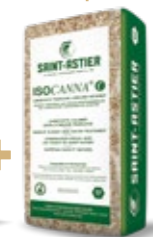
ISOCANNA® 20 KG