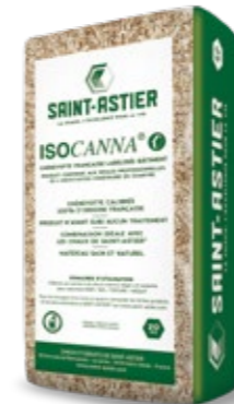
ISOCANNA® - 20 KG Chènevotte française labellisée « Chanvre Bâtiment »